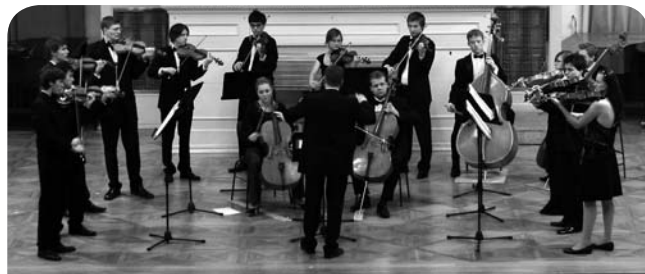
Moravský komorní orchestr na lednovém koncertě