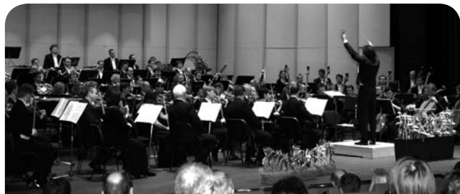
Filharmonie se svým šéfdirigentem na Novoročním koncertě