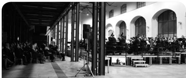
Symfonie „Věk úzkosti“ ve Wannick Gallery