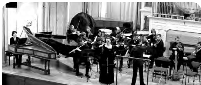
Ensemble Opera Diversa při provedení kantáty Metařka listí