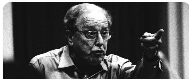
Sir Charles na zkoušce s brněnskou filharmonií (2004)

Alan Charles Maclaurin Mackerras se narodil v roce 1925 v americkém Schenectady australským rodičům, kteří se s ním po třech letech vrátili do Sydney. Sedmiletý začal s houslemi, později s flétnou, osmiletý se jal zhudebňovat básně a dvanáctiletý napsal klavírní koncert. Rodiče znepokojeni těmito aktivitami ho poslali na prestižní Královu školu (The King's School), ale mladému hudebníku nevyhovovala její přísná kázeň a sportovní orientace – několikrát zběhl a nakonec byl vyloučen. Šestnáctiletý se konečně dostal na konzervatoř, kde studoval hoboje, klavír a kompozici; živil se psaním orchestrálních partitur ze zvukových záznamů. Devatenáctiletý nastoupil do orchestru ABC Sydney, pět let poté odplul do Londýna