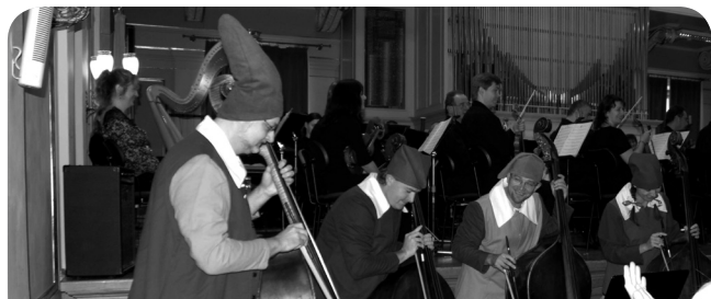
Kontrabasová sekce hraje pro děti