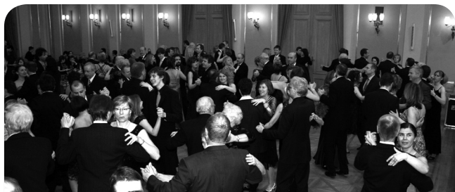
Z loňského 15. reprezentačního plesu